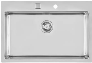
Évier KE Filotop 2266 050