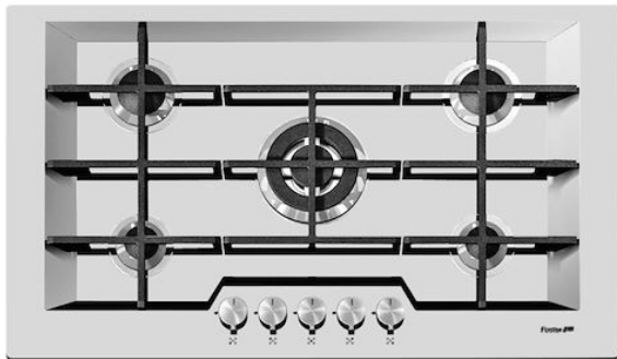
Table de cuisson KE